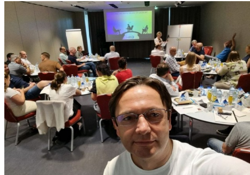
Vienna, 26 30 June 2023, SPoR workshops on Semiotics and iCue Engagement